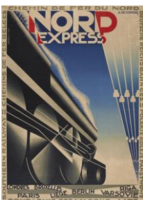
A.M. Cassandre Chemin de Fer du Nord / Nord Express , Frankreich, 1927 Farblithografie, 105 x 75,2 cm

PHOTOGRAPHY MASTERS Folkwang Universität der Künste 9. Februar – 26. Mai 2024