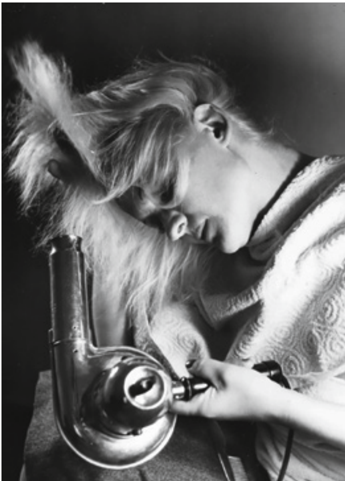
Dorothea von der Osten, Kosmetik (Beim Föhnen), 1950er

→ Teilnahme kostenfrei. Ohne Anmeldung. Ansprechpartnerin: merve.baran@museum-folkwang.essen.de