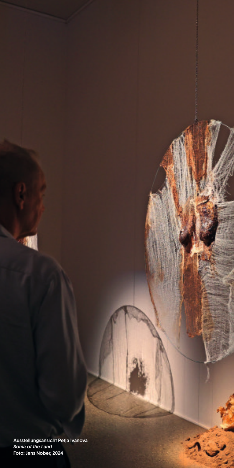
Ausstellungsansicht Petja Ivanova Soma of the Land